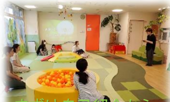
まずは自己紹介から