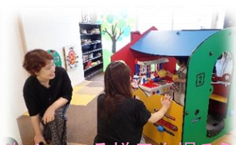
遊んでいる様子を撮ろう!