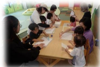
まずは台紙選びから