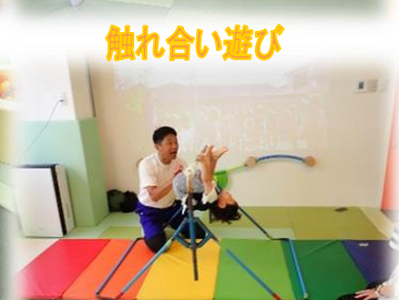
足抜き回りができたよ!