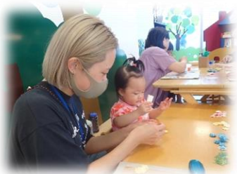
何色の花を貼ろうかな