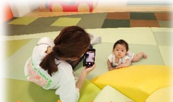
シャッターチャンス!