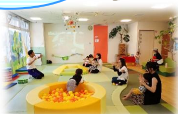
まずは手遊びから