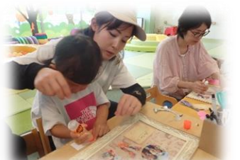
のりを上手に貼っていますよ