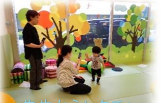
先生からレクチャー